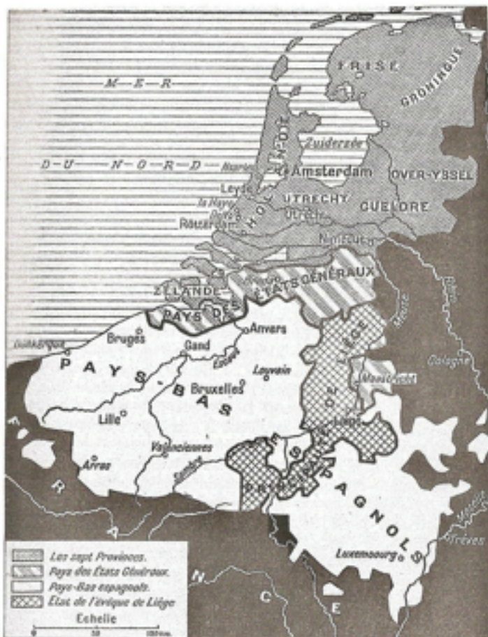
PAYS-BAS ESPAGNOLS ET PROVINCES-UNIES DE 1581 à 1648. (J. Isaac) On voit les sept provinces du Nord groupées depuis 1581 sous le nom de Provinces-Unies. Les hostilités avec l'Espagne, interrompues par une trêve en 1609, reprirent de 1621 à 1648. Durant cette seconde guerre, les Provinces-Unies enlevèrent aux Pays-Bas espagnols les territoires marqués sous le nom de Pays des États généraux, ainsi que l'enclave de Maastricht sur la Meuse.

Contournez en rouge les Pays-Bas espagnols et dessinez le Duché de Luxembourg en jaune.