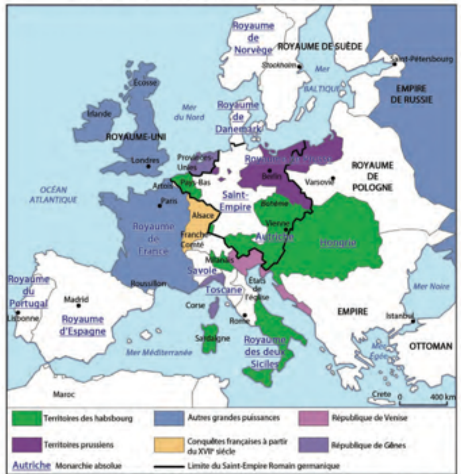
Carte de l'Europe au début du XVIII e siècle

Tous ces États européens cherchent à affirmer leur puissance et sont en constante rivalité. Ainsi, certains s'affaiblissent (ex : Saint Empire romain germanique, royaume d'Espagne, empire ottoman), tandis que d'autres s'affirment (ex : royaume de France, empire de Russie, Angleterre). La dynastie des Habsbourg reste encore puissante, mais c'est la France (et la dynastie des Bourbons) qui devient la première puissance du continent européen.